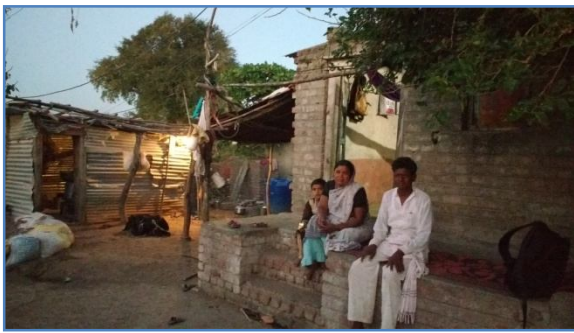
चित्र 5 अनिकच्या कर्जाच्या मदतीने गायरान धारकाने सुरु केलेली गिरण व विकत घेतलेल्या शेळ्या

ज्या गायरानधारकांच्या नावाने अजून जमीन झालेली नाही त्यांना शेतीसाठी बँकेकडून कर्ज मिळू शकत नाही. त्यांच्यासाठी बचतगट हा कर्ज मिळविण्यासाठीचा प्रमुख स्रोत आहे. अभ्यास केलेल्या ज्या गावांत अजून जमीन मालकीची झाली नव्हती, त्याठिकाणी अनिक फायनान्स च्या बचतगटांमधून गायरानधारक कर्ज घेत होते. ही कर्जे बियाणे/ खते विकत घेणे, पाण्यासाठी मोटार किंवा पाईपलाईनची व्यवस्था करणे, जमिनीच्या मशागतीची कामे ह्यासारख्या शेतीच्या