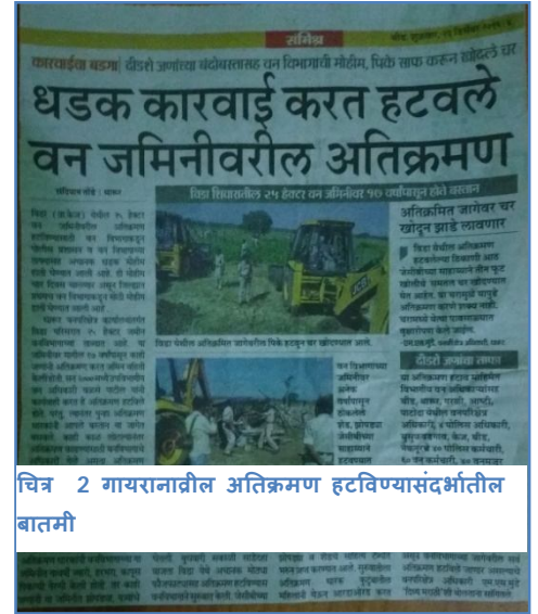
चित्र 2 गायरानावरील अतिक्रमण हटविण्यासंदर्भातील बातमी

१९९१ नंतर धोरणात झालेला दुसरा बदल म्हणजे गायरान जमीन ही भूमिहीन शेतकऱ्यांना कसण्यासाठी खुली करून देण्यापेक्षा विविध शासकीय आणि खाजगी प्रकल्पांना देण्याकडे शासनाचा असलेला कल. डिसेंबर २०१६ मध्ये झालेल्या मंत्रिमंडळाच्या बैठकीत घेतलेल्या निर्णयावरून ह्या बाबतीत घेतलेली ठोस पाऊले दिसून येतात. २७ डिसेंबर २०१६ रोजी झालेल्या १११ व्या मंत्रिमंडळ बैठकीत महाराष्ट्र जमीन महसूल संहिता १९६६ च्या संहिता २२ मध्ये कलम (क) समाविष्ट करण्यात आला. त्या अंतर्गत जिल्हाधिकाऱ्यांना अधिकार देण्यात आले आहेत कि काही विशिष्ट परिस्थितीत गावातील