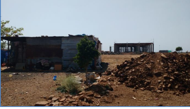
चित्र 3 जमीन कसली जात असताना कुठलीही सूचना न देता पॉवर ग्रीड प्रकल्पासाठी घेण्यात आलेली गायरान जमीन

शासनाच्या ह्या बदलत्या धोरणांचा परिणाम अभ्यास केलेल्या काही गावांमध्ये दिसून आला. अभ्यासातील एका गावामध्ये गायरानधारक अनेक वर्षे कसत असलेली जमीन, त्यांच्या कसण्याची दखल न घेता वन विभागाकडे वर्ग करण्यात आली तर दुसऱ्या ठिकाणी ती जमीन पॉवर ग्रीड प्रकल्पासाठी देण्यात आली.